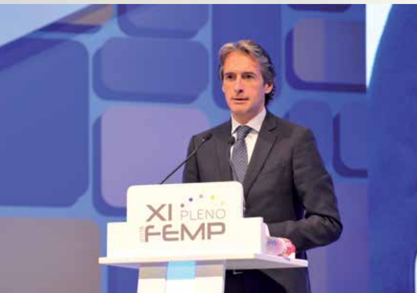
El Alcalde de Santander, en la sesión de apertura del Pleno.

"Cerramos un ciclo con una Federación más fuerte, más reconocida institucionalmente, con un mayor peso político, con mayor músculo financiero y más transparente. Deseo que la nueva Junta de Gobierno tenga la mejor de las suertes y ofrezco toda mi colaboración para ayudar desde la máxima lealtad y desde la convicción de la unidad que necesitamos en esta Federación" , señaló finalmente.