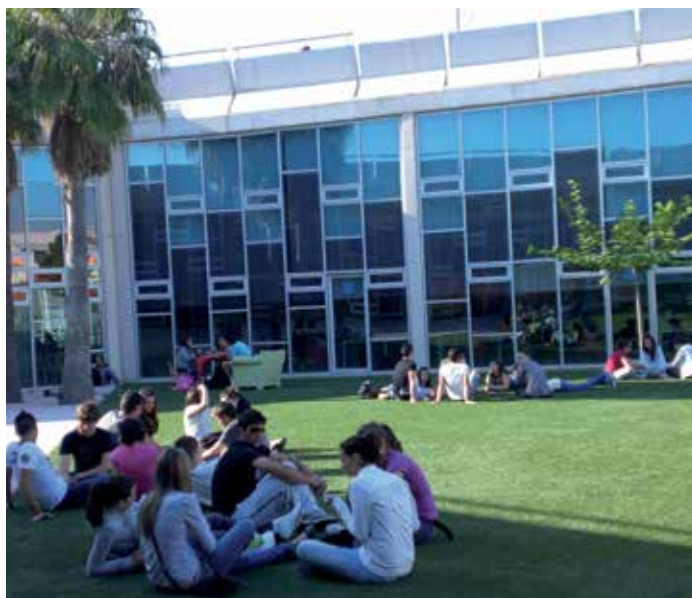
Exterior de la Biblioteca de Torre de Pacheco.