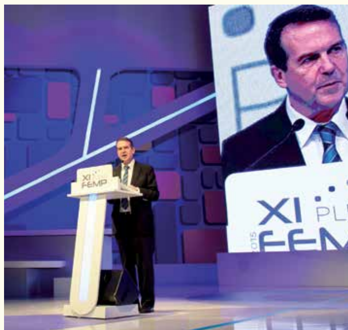
El Alcalde Vigo durante su intervención como nuevo Presidente de la FEMP.

"Un nuevo gran reto nos aguarda. La gran crisis de refugiados, la que provocan las guerras, los dictadores. Y ahí queremos estar los Alcaldes y Alcaldesas, en nuestros pueblos y ciudades. Con los brazos de la solidaridad abiertos. Con la grandeza de apoyar los derechos humanos. Y desde el cumplimiento de las directrices del gobierno de España, al que le corresponde la iniciativa, pero diciendo que ni un titubeo en escatimar apoyo".