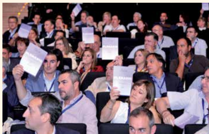
Votación de enmiendas en la sesión de la tarde del Pleno.

La FEMP seguirá participando activamente en aquellos foros y organismos consultivos en los que, a nivel internacional, se consideren necesarios para defender la aportación indiscutible de los Gobiernos Locales. Asimismo, solicitará formar parte de aquellos procesos de elaboración de normativa que afecte a los intereses locales en esta materia y pondrá a disposición de todos los Gobiernos Locales los instrumentos de información, planificación y gestión de los que dispone, en particular la plataforma on-line de cooperación y el informe anual de la cooperación pública local. ★