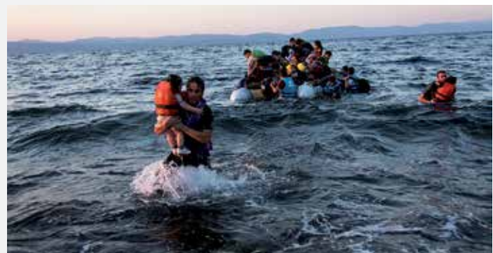
Refugiados en el Mediterráneo.