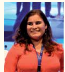
Concepción Brito Núñez, Alcaldesa de Candelaria (Sta. Cruz de Tenerife)