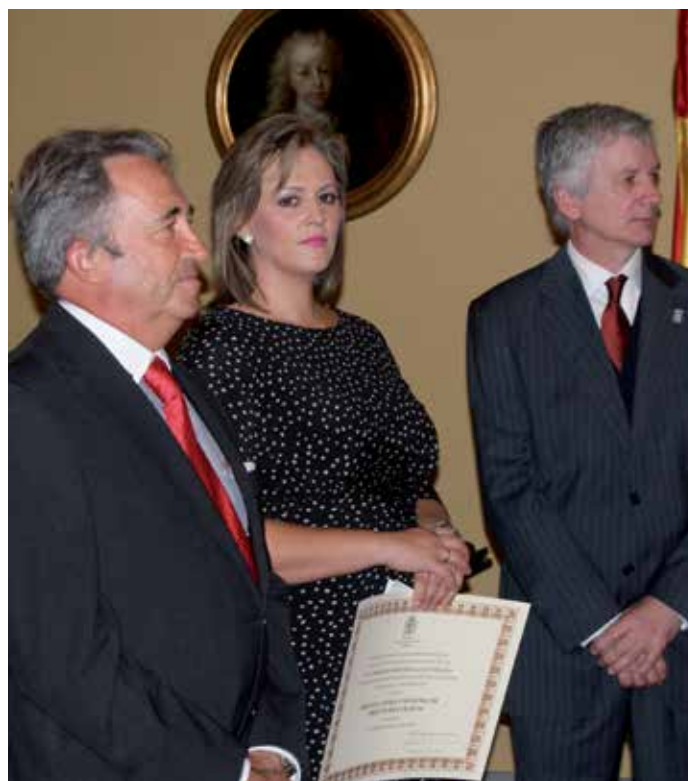
La Alcaldesa de Torre Pacheco, con los Concejales de Fuente el Saz y Soto del Barco en los premios.

El proyecto premiado, Leyendo en Fuente el Saz, se articula en varios bloques temáticos (Quincena del Libro, Biblioteca de Otoño y Navidades), dentro de los cuales se proponen distintas actividades para todas las edades y como hace ya varios años, con presupuesto cero. Sus responsables destacan tres aspectos básicos por los que se ha apostado en este proyecto: el colectivo infantil y juvenil, la biblioteca como centro de difusión local y referencia cultural, y el apoyo a instituciones y asociaciones locales.