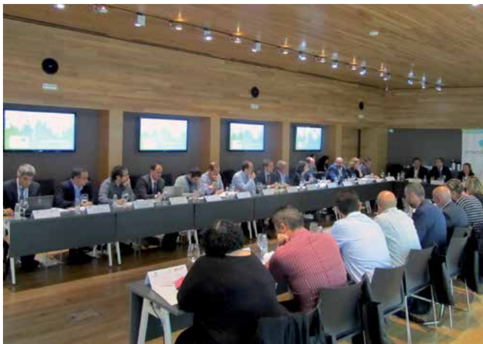
La reunión de la Junta Directiva se celebró en Logroño.