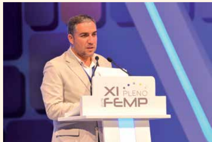
Eliás Bendodo, Presidente de la Diputación de Málaga, ponente en la Mesa de Sostenibilidad y Territorio.

Asimismo promoverá que los Gobiernos Locales lleven a cabo las acciones que sean precisas para fomentar el uso del transporte público urbano colectivo con medidas como la mejora en la frecuencia de paso, la introducción de nuevas tecnologías en el billeteaje que favorezca el acceso a los vehículos, la información en tiempo real al usuario, el incremento de