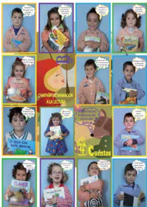
Cartel de Caperucita de la Biblioteca de Soto del Barco.