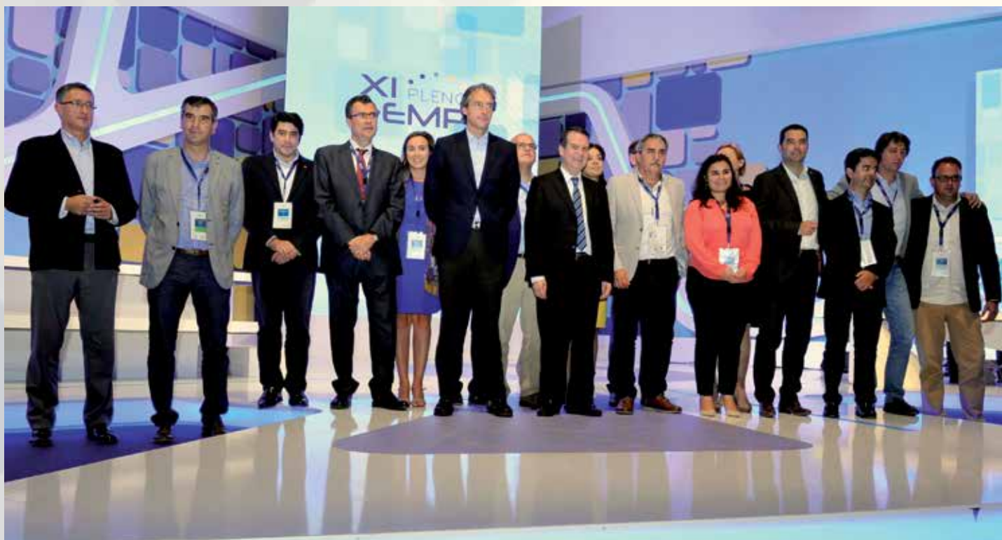
La nueva Junta de Gobierno de FEMP.