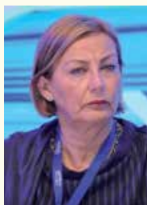
Mariví Montesión Rodríguez, Alcaldesa de Avilés (Asturias)