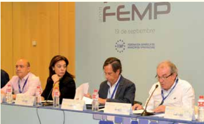
Mesa de Cohesión Social.