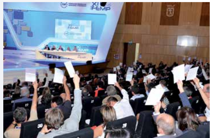
Votación de Resoluciones en el Plenario.

Otras medidas aprobadas son: favorecer unas políticas de calidad en la prestación de los servicios mortuorios municipales, respetando la libertad de cultos, y buscando fórmulas de cooperación con las asociaciones de cementerios y servicios funerarios; e impulsar políticas de tenencia responsable de animales de compañía en los municipios, para potenciar el respeto de los derechos de los animales, y promover normas de calidad en los centros de protección animal.