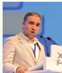
Elías Bendodo Benasayag, Presidente de la Diputación de Málaga