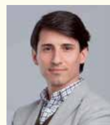
Jesús Mº Zaballos de Llanos, Alcalde de Lasarte-Oria (Guipúzcoa)