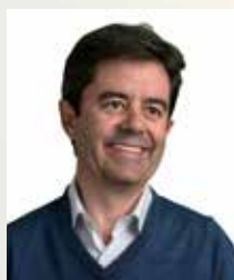
Luis Felipe Serrate, Alcalde de Huesca