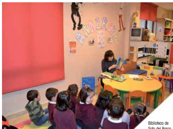
Biblioteca de Soto del Barco.