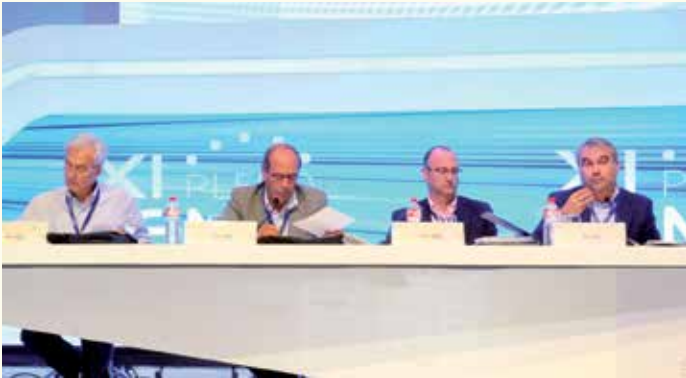
Mesa de Economía y Administración Local.

Las 185 propuestas de Resolución y las enmiendas presentadas fueron estudiadas en cuatro Mesas de Trabajo, tres de carácter sectorial y una cuarta sobre Estatutos. En total, se debatieron más de 60 enmiendas y algunas de ellas, en forma de votos particulares, se mantuvieron para la sesión plenaria. Finalmente, el plenario aprobó 186 Resoluciones y una declaración institucional sobre los refugiados.