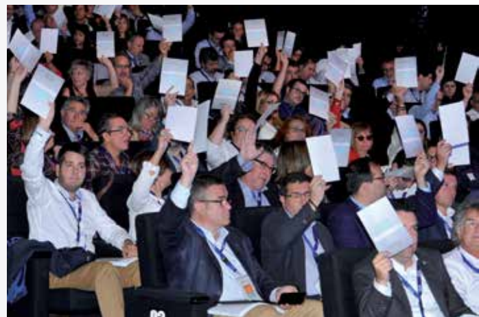
Volación en la Mesa de Economía y Administración Local.

La FEMP impulsará la colaboración con los diferentes Ministerios, en especial promoverá su participación en iniciativas como el Plan Integral de Apoyo a la Competitividad del Comercio Minorista de España, y