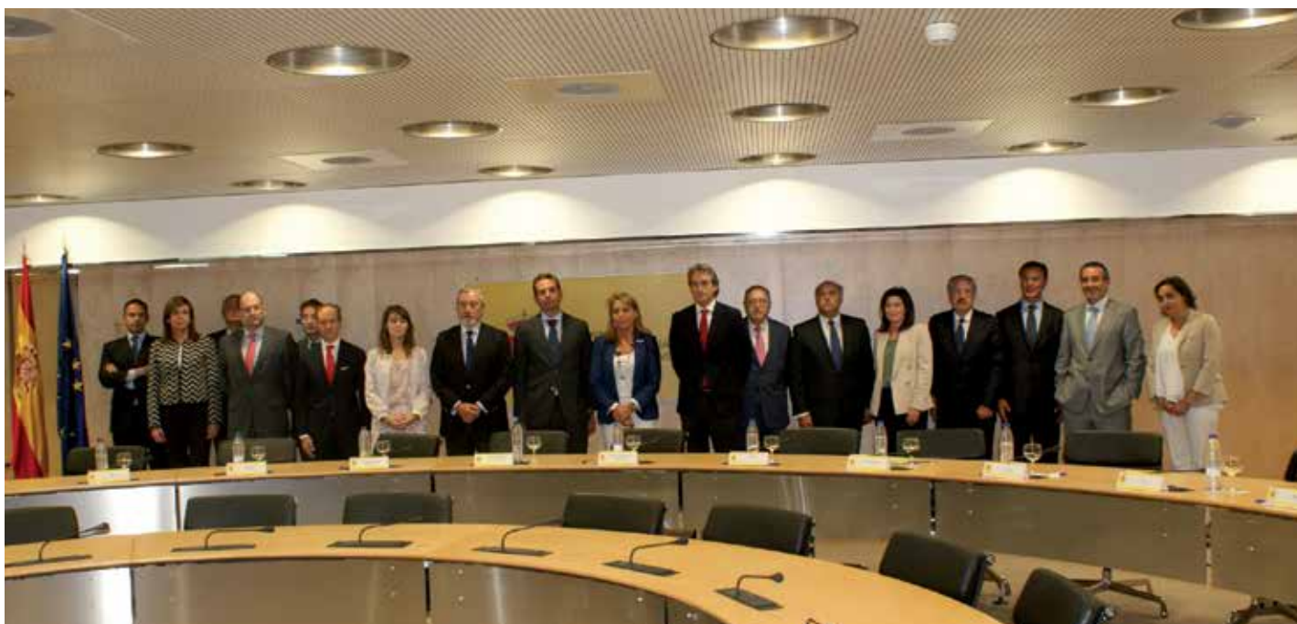
Los firmantes, tras rubricar el nuevo acuerdo.

El FSV se creó en enero de 2013 con 5.892 viviendas aportadas por los bancos para dar asistencia a las familias más vulnerables mediante alquileres reducidos (entre 150 y 400 euros al mes, con un límite máximo del 30% de los ingresos de la unidad familiar). Expiraba a los dos años de su constitución (17 de enero pasado) pero el Gobierno lo ha prorrogado dos años más, hasta enero de 2017. Se constituyó por acuerdo entre los Ministerios de Economía, Sanidad y Fomento, las principales entidades de crédito y sus asociaciones, la Federación Española de Municipios y Provincias (FEMP) y la Plataforma del Tercer Sector.