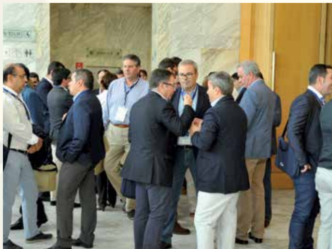
Asistentes al XI Pleno de la FEMP.

(Carta Local incluye en las páginas 14 y 15 un amplio resumen del discurso de Abel Caballero).