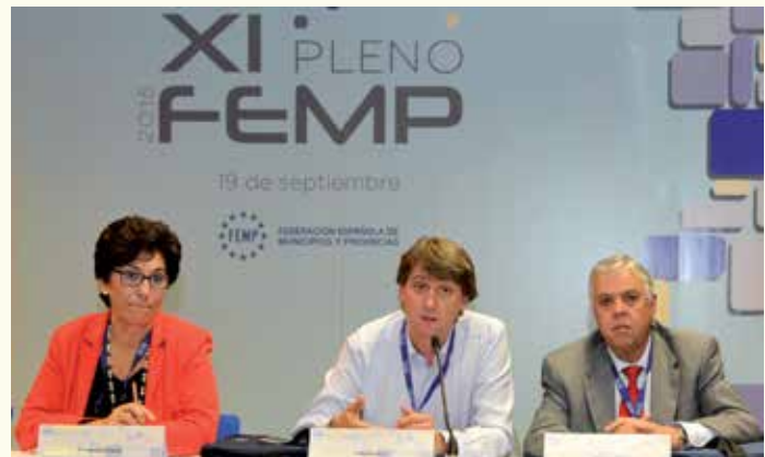
Mesa de Estatutos.