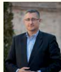
Manuel Blasco Marques, Alcalde de Teruel