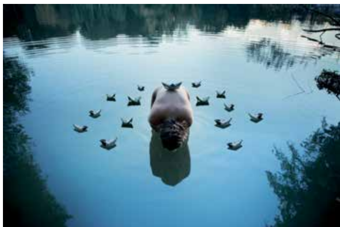
Irene Cruz fue la autora de esta fotografía, "MarV", galardonada en la edición anterior

Ecoalf es una empresa española de moda que parte de una filosofía muy sencilla: los recursos del planeta no son ilimitados y estamos consumiendo en los países industrializados cuatro veces más de lo que el planeta es capaz de generar. Ante esa circunstancia, el reciclaje puede ser una gran solución si somos capaces de crear una nueva generación de productos reciclados con la misma calidad