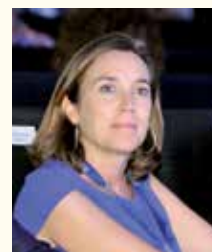
Concepción Gamarra Ruiz-Clavijo, Alcaldesa de Logroño (La Rioja)