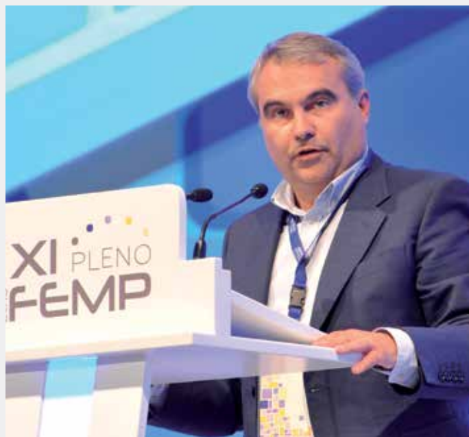
Intervención del Alcalde de Badajoz, Francisco Javier Fragoso.

La FEMP instará a promover la mejora de la representatividad democrática de Ayuntamientos y comarcas e institucionalización de prácticas políticas y administrativas de gobierno abierto y democracia participativa, e instará al Gobierno de España a la derogación de la modificación de la Disposición Transitoria Séptima de la Ley de Racionalización y Sostenibilidad de la Administración Local, modificación que elimina la cobertura legal a la prestación de las funciones de tesorería desempeñada por Concejales.