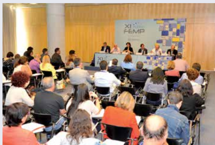
Un momento del debate en la Mesa de Cohesión Social.

La FEMP promoverá acciones de formación e información en materia de políticas públicas de ordenación en instalaciones deportivas, con el propósito de explorar en el diseño y aplicación de todo tipo de herramientas que permitan la mejora de la seguridad, la accesibilidad, la eficiencia energética y sostenibilidad medioambiental, el mantenimiento y la gestión de las infraestructuras deportivas municipales.