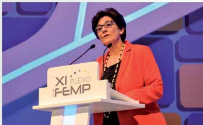
La Alcaldesa de Pozuelo, Susana Pérez Quisiant, en la Mesa de Estatutos.

Por último, propone instar al Ministerio competente a que ponga los medios necesarios para la eliminación de las discriminaciones existentes en la prestación del Servicio Universal de Telecomunicaciones (telefonía móvil, internet, etc.), que derivan de razones geográficas y/o de densidad de población.