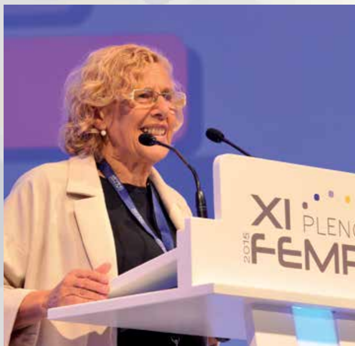
La Alcaldesa de Madrid fue la encargada de dar la bienvenida a los Alcaldes y electos locales que acudieron al Pleno de la FEMP.

Poco después de las diez de la mañana dio comienzo el XI Pleno de la FEMP con unas palabras de bienvenida de la Alcaldesa de Madrid, Manuela Carmena. En su calidad de anfitriona, resaltó la "capacidad" de los madrileños para estar dispuestos siempre a la acogida,