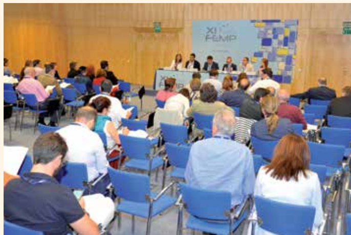
Participantes en los debates de la Mesa de Sostenibilidad y Territorio.

También, impulsar políticas locales de prevención, reutilización, reciclado y valorización de residuos tendentes al desarrollo de una economía circular; planes de acción contra la contaminación acústica que favorez