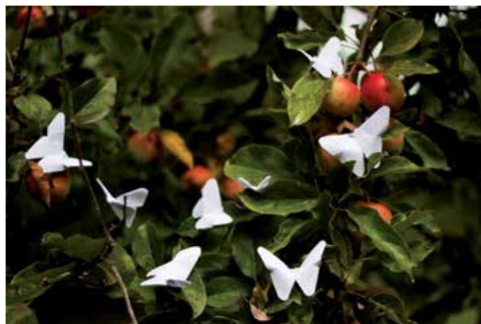
"Boliboretas", una fotografía ganadora del concurso pasado, obra de Abraham Vázquez Belisario

Toda la información relativa al concurso, incluidas las bases legales, podrán consultarse en la sección concursos de www.ffi.es . ★