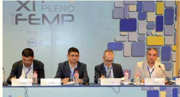
Mesa de Sostenibilidad y Territorio.