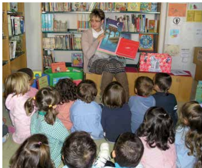
Actividad con niños en Fuente el Saz.

La responsable de la Biblioteca concluye que la ausencia de presupuesto ha llevado a buscar otras alternativas "para poder seguir cumpliendo con nuestra misión de fomento de la lectura, buscando sinergias con profesionales amigos de la biblioteca, asociaciones, entidades, organizando actividades en torno a la lectura con participación ciudadana". Por ello, afirma que "este premio es sobre todo suyo, por haber convertido esta pequeña biblioteca una gran familia unida por el prodigio de la lectura".